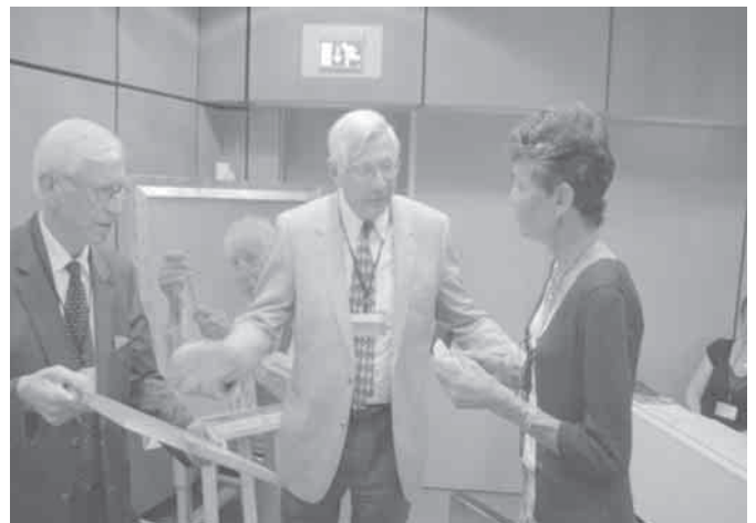
Willem Kolff Stichting