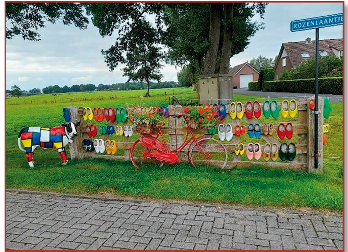
Eén van de foto's onderweg

Onderweg was er halverwege de route koffie of thee met gebak beschikbaar. Ook dat werd op prijs gesteld.