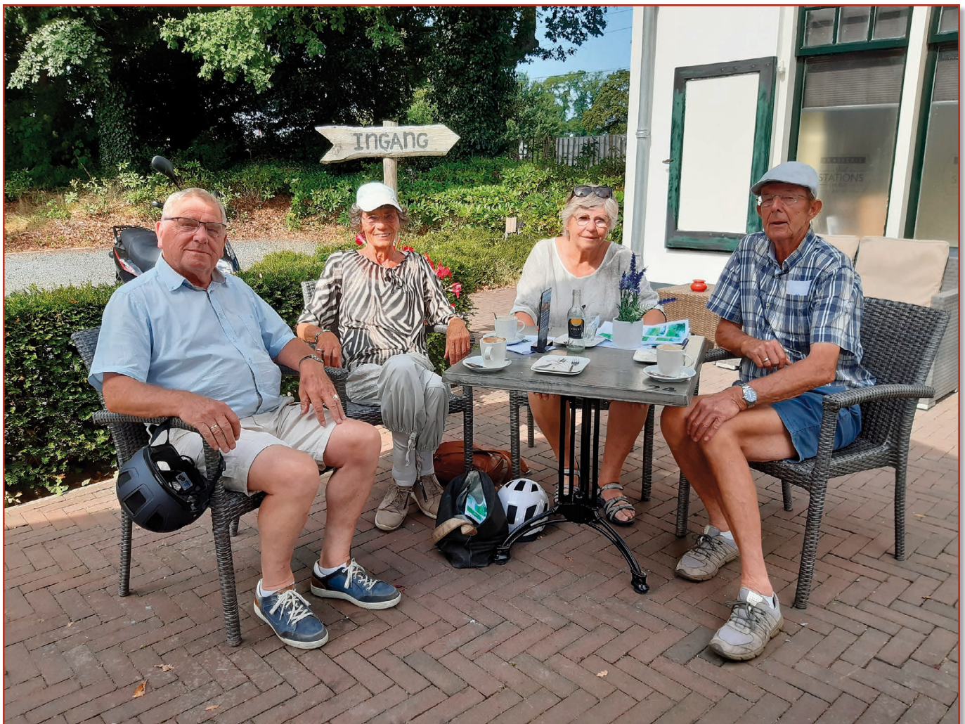
Even bijkomen onderweg

Al met al een geslaagd evenement en een poging om elkaar weer eens te ontmoeten in deze coronatijd met al z'n beperkingen.