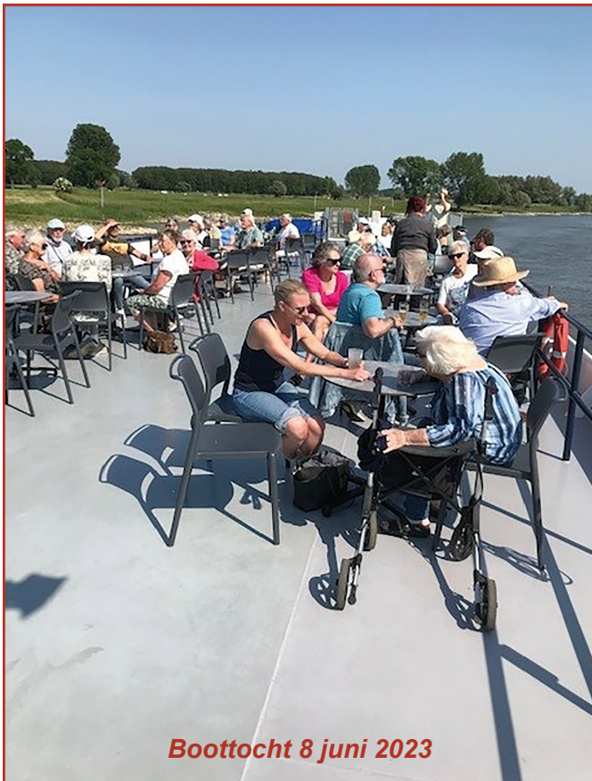
Boottocht 8 juni 2023