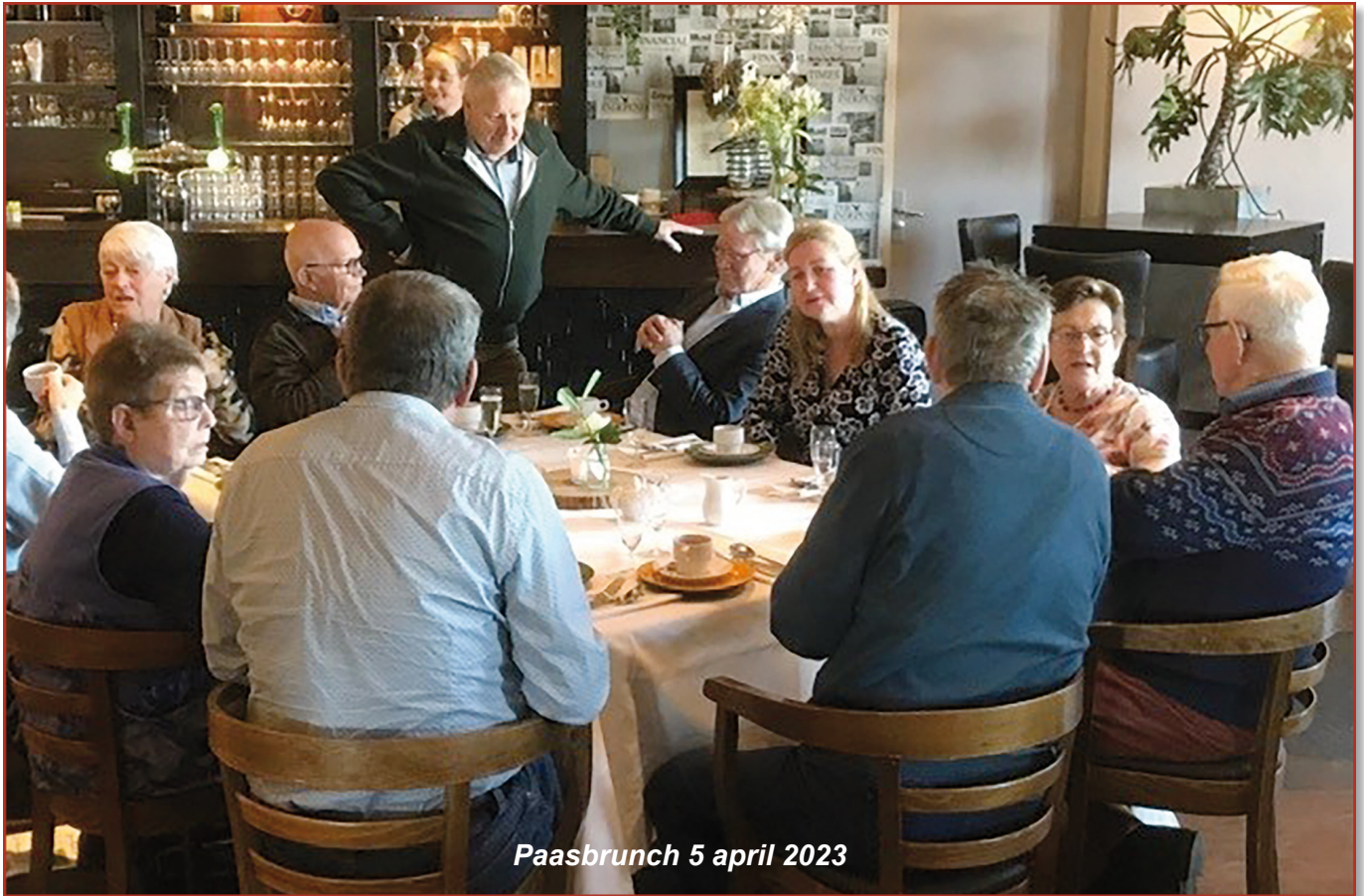
Paasbrunch 5 april 2023