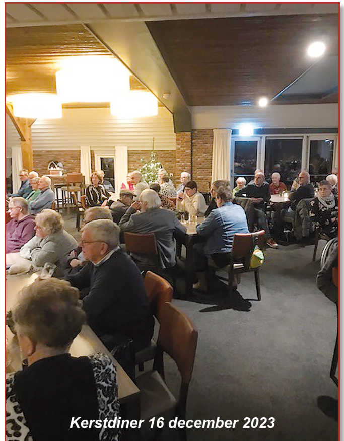
Kerstdiner 16 december 2023